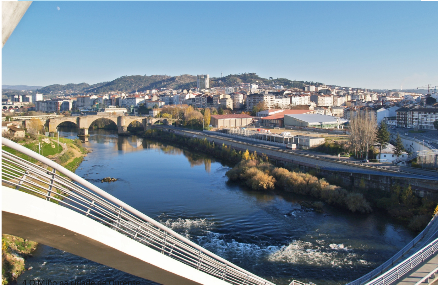
4 O Miño na cidade de Ourense