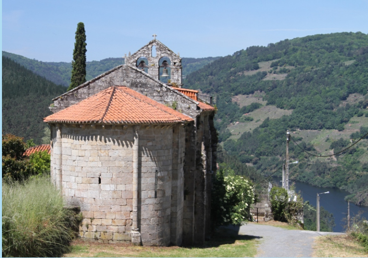
Igrexa de Santa María da Cova, na Ribeira Sacra