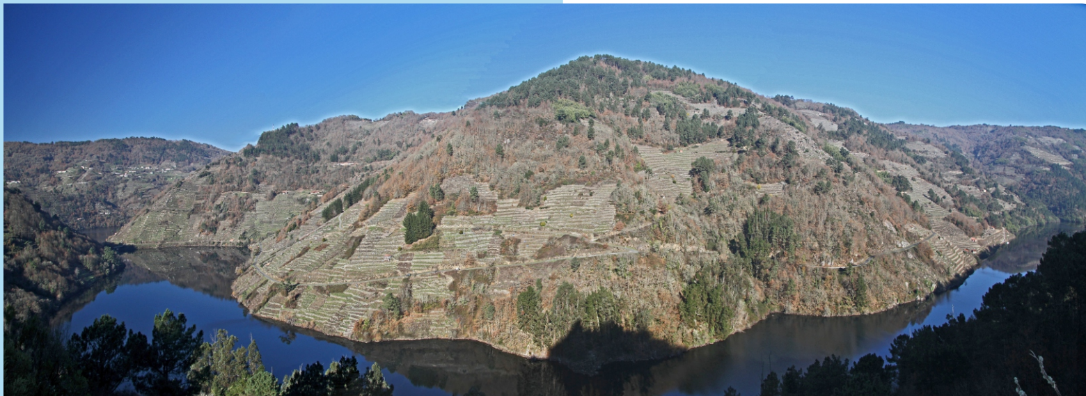
O Cabo do Mundo no Canón do Miño no inverno